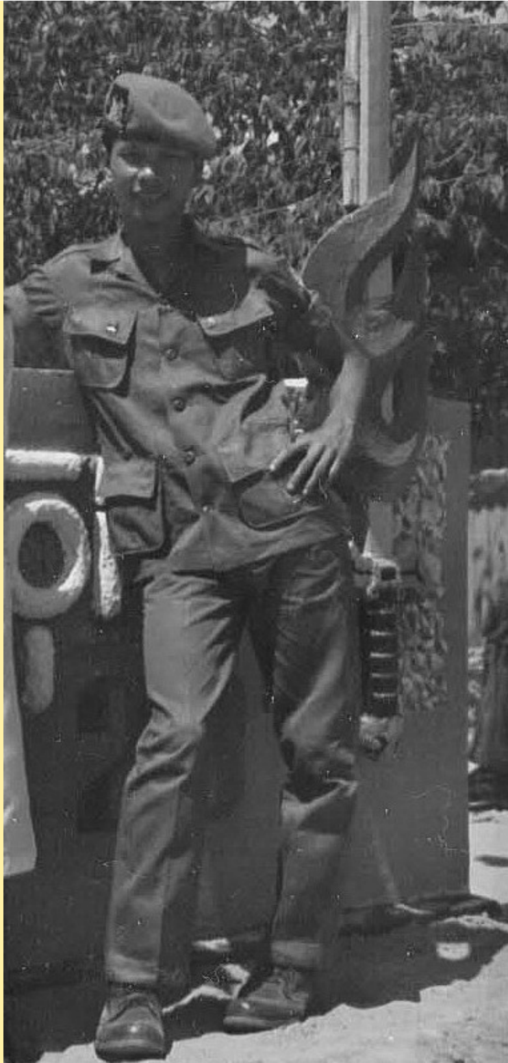
Hình chụp trước ĐĐ 22